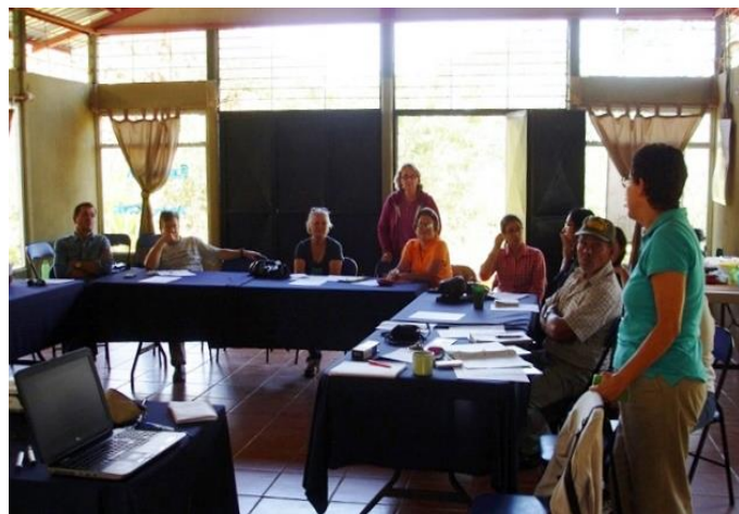
Ilustración 3. Taller de Evaluación Final