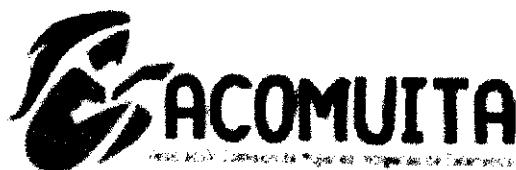
Figura 2: Logotipo de ACOMUITA

La Asociación Comisión Mujeres Indígenas de Talamanca (ACOMUITA) es una organización constituida por 74 mujeres de las comunidades bribris y cabécares de Talamanca, en su mayoría jefas de hogar, además de productoras de cacao, banano y plátano. Su propósito es recuperar el protagonismo y el rol activo de las mujeres en la economía y la política locales.