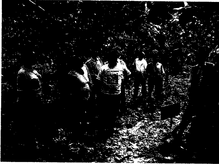
Figura 3 Equipo de trabajo de ACOMUITA desarrollando el Tsirutami Tour con grupo de visitantes ngäbe de Panamá

ACOMUITA cuenta con tres áreas o departamentos: