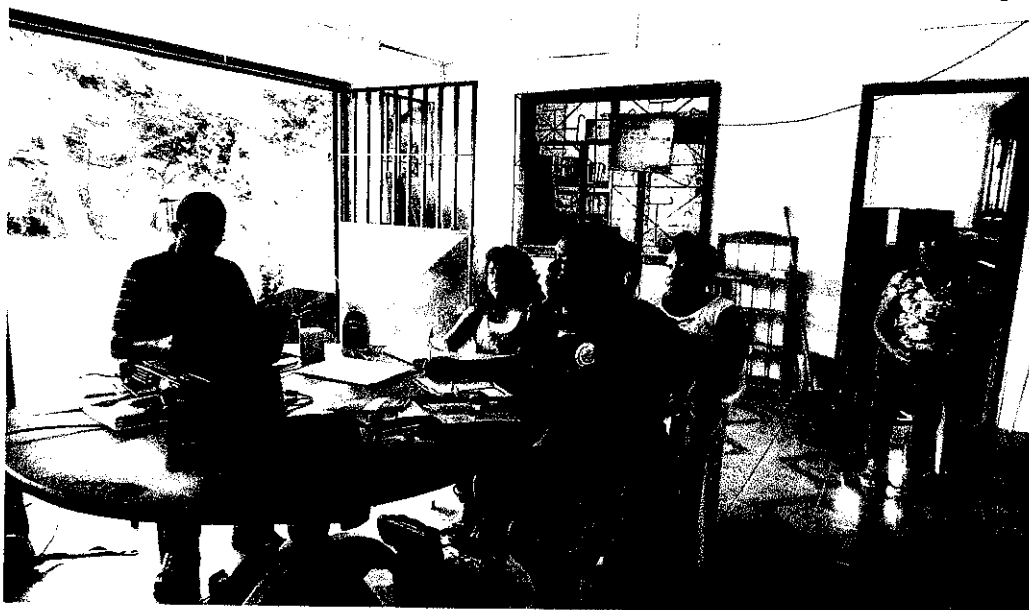
Figura 1 Directivas y asociadas participantes en el proceso de evaluación final del proyecto

En este reporte se presentan los resultados de esta evaluación participativa, realizada durante los años 2015 y 2016 en la oficina de la organización (Figura 1).