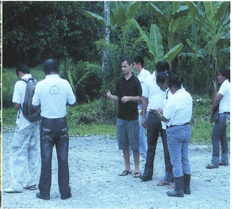
CURSO EN GPS RECIBIDO EN EL MES EMARZO 2013