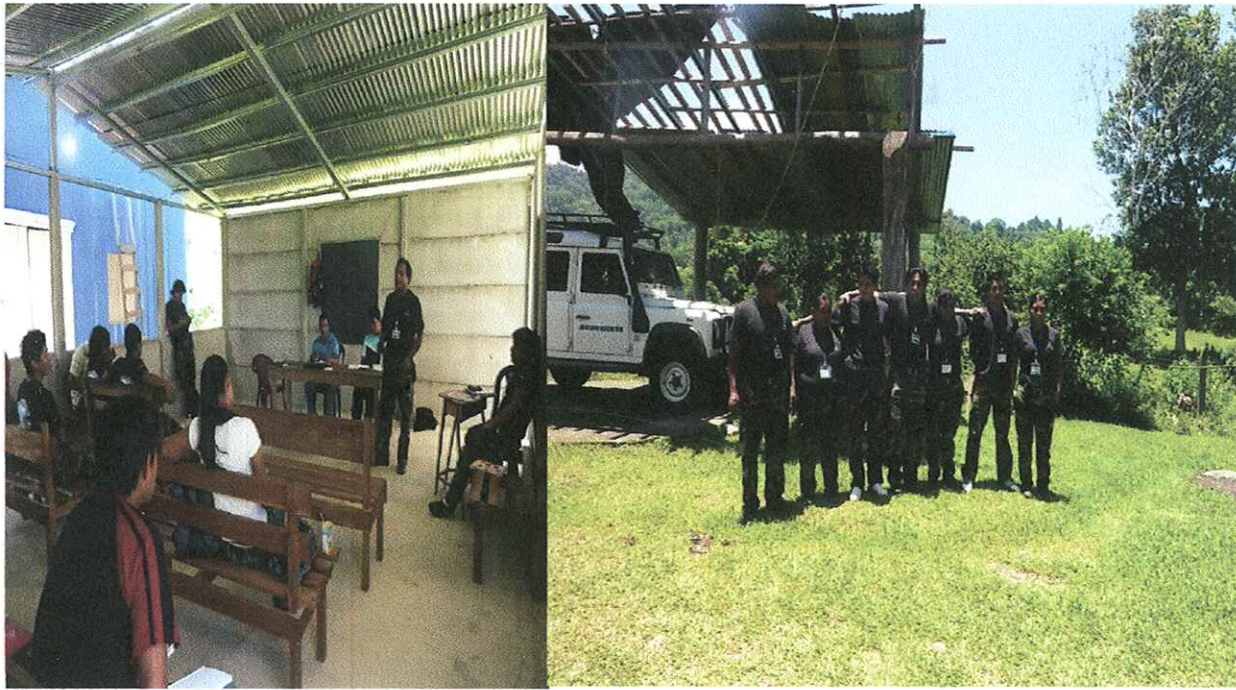
TALLER DE INTERCAMBIO EN TAINY GURADA RECURSO DE BAJO CHIRRIPO Y TAINY.