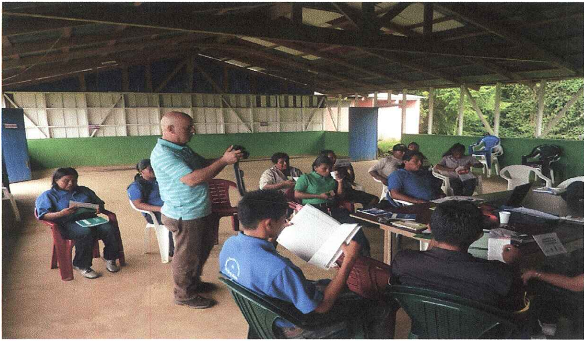
Capacitación recibida con ppd. Diciembre 2012