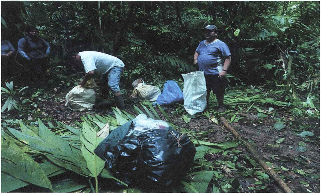
OPERATIVO EN AREA DE BOSQUE AÑO 2013.