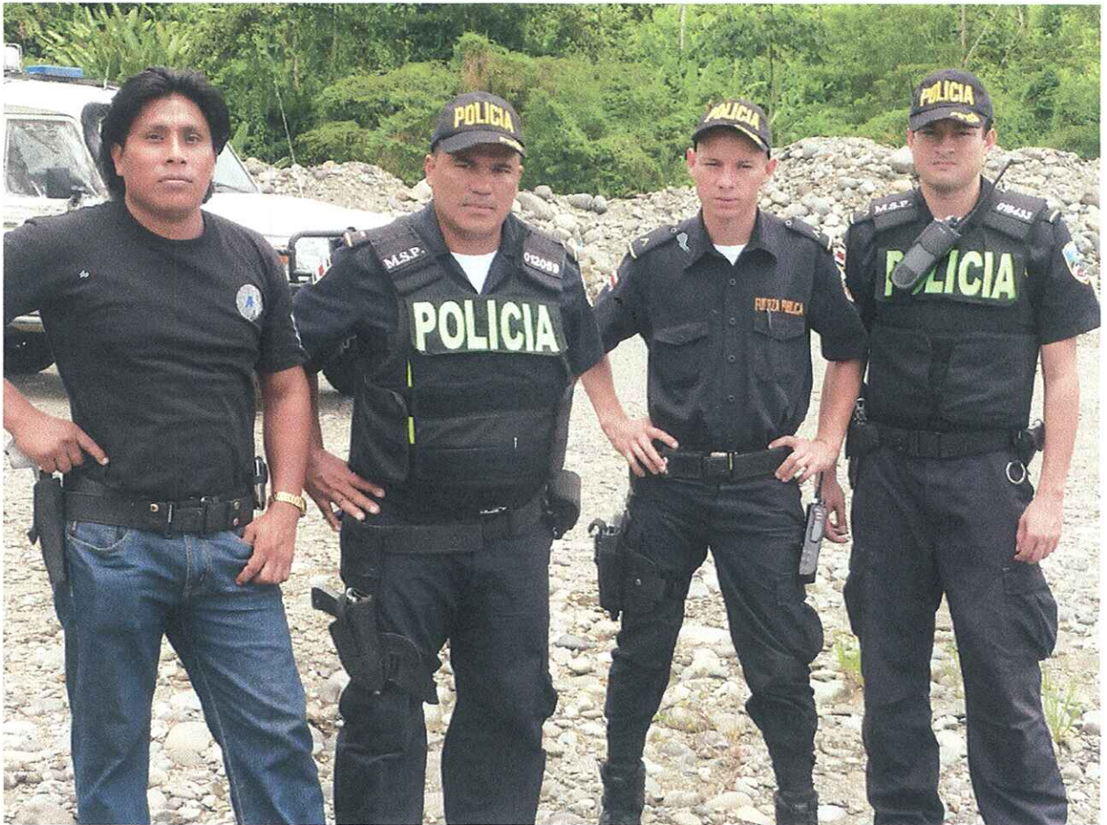
OPERATIVO CON APOYO DE LA FUERZA PUBLICA EN BAJO CHIRRIPO MES MARZO 2013.