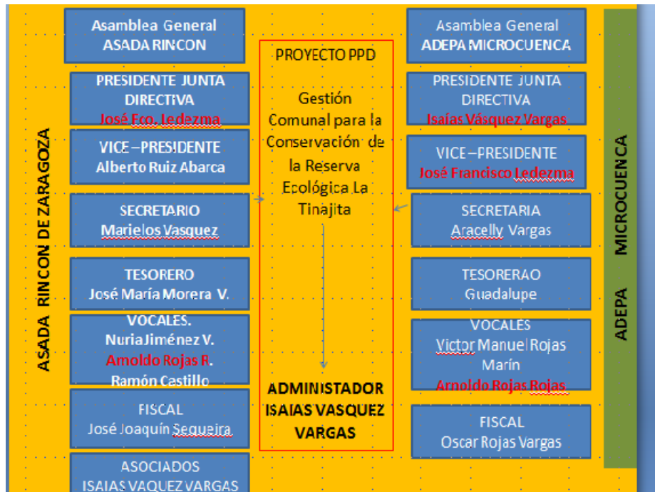
Organigrama 2: Juntas Directivas y relacionamiento entre ambas organizaciones por medio del nombramiento de un Administrador del Proyecto PNUD