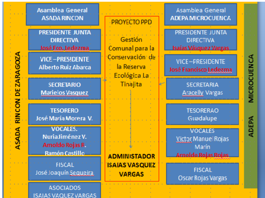
Organigrama 1: Juntas Directivas y relacionamiento entre ambas organizaciones por medio del nombramiento de un Administrador del Proyecto PNUD