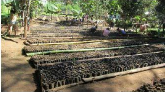
Vivero ASOBRUNKA, diciembre 2012

B- El Chagüite: 50 familias CON CHAGUITE : En el mes de mayo 2013 el PPD propicio un intercambio con los grupos indígenas socios del programa que visitaron nuestra comunidad para un intercambio de experiencia, fue muy positivo y alentadora para ASOBRUNKA.