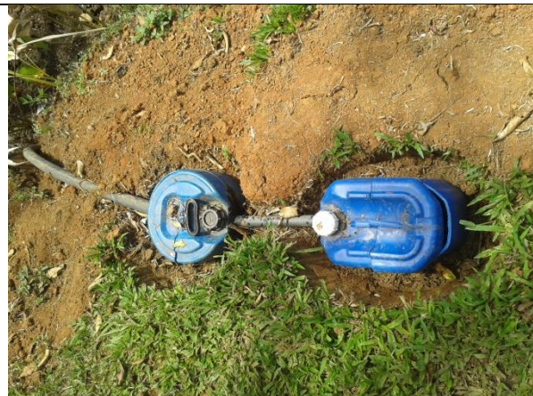
Biojardinera para tratamiento de aguas jabonosas