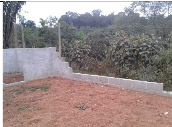
Construcción de centro de atención a turistas con área de servicios sanitarios y duchas