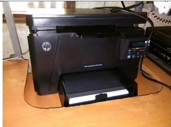
Video Beam e Impresora