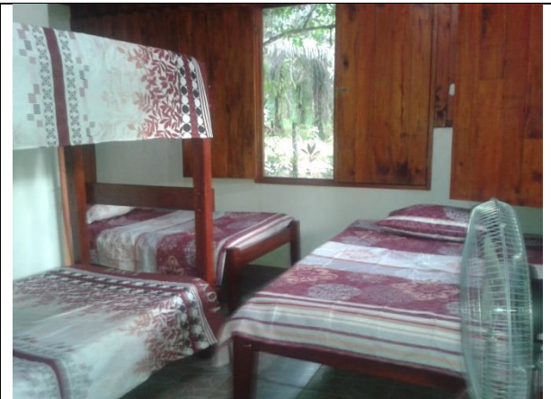
Acondicionamiento de las habitaciones