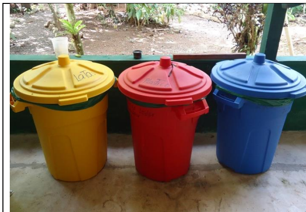
Recipientes para la separación de desechos

Un proyecto bastante estable. Comparado con otros proyectos, recibe un número considerable de turistas al año (unas 300 personas). Su principal problema sigue siendo la comunicación por falta de señal celular en la zona; aunque su nivel de respuesta es de 1 día. En cuanto a infraestructura y servicios para los turistas está bien; sin embargo, la mayoría de las veces hay desorden en el proyecto (zapatos en la entrada, ropa tendida, etc).