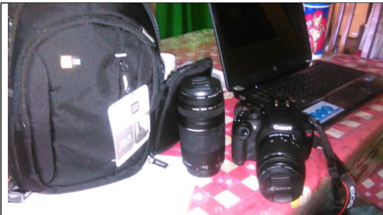
Maletín, cámara y computadora

En cuanto al fortalecimiento propio para la administración de la Cooperativa, se realizó la compra de varios materiales como impresora, video beam, teléfono celular, sistema de amplificación, maletines y computadora. A continuación las fotografías del equipo adquirido: