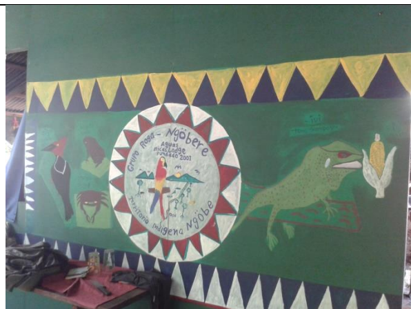
Pinturas y decoración sobre la cultura Ngöbe