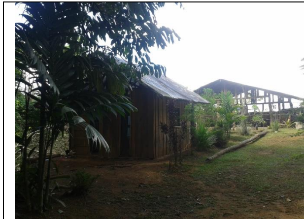
La nueva cabaña y en el fondo la cocina