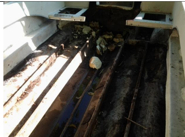
Trabajos de remodelación del casco