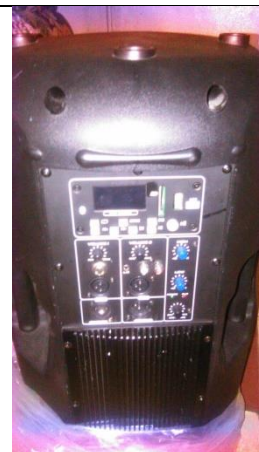
Sistema de amplificación de sonido