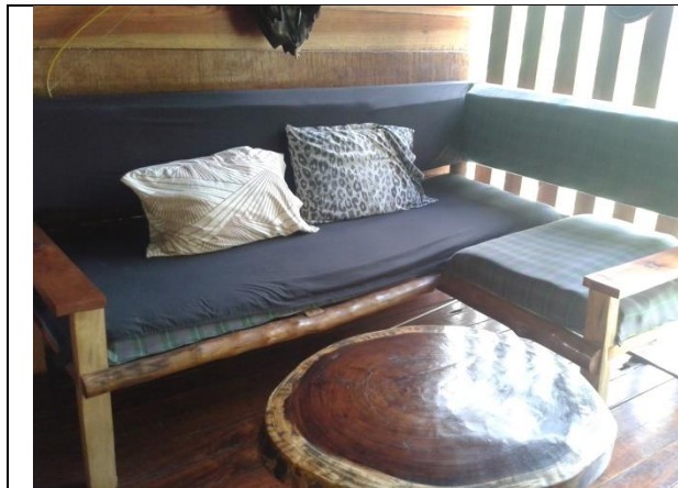
Mejoras dentro de la casa grande