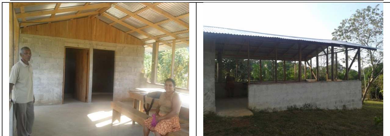
Centro de atención a turistas en Cinta Blanca