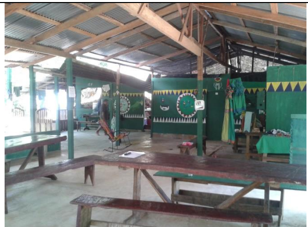
Mejoramiento de la infraestructura