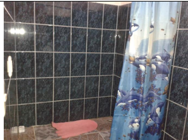
Baños en excelentes condiciones