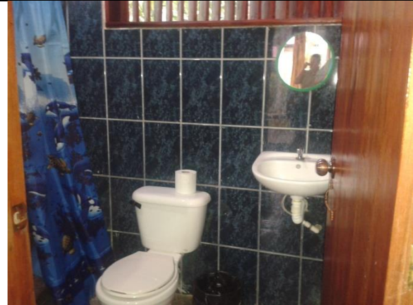
Acondicionamiento de las habitaciones