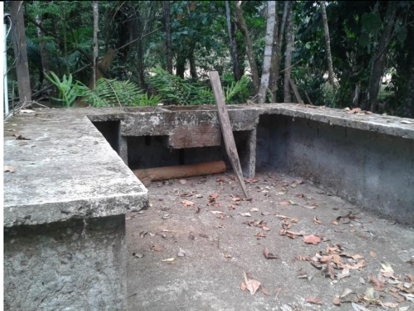
Plan de nueva área de cocina