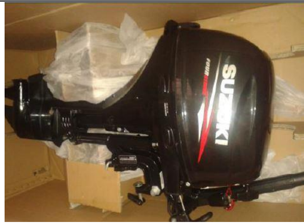
Compra de motor 20HP