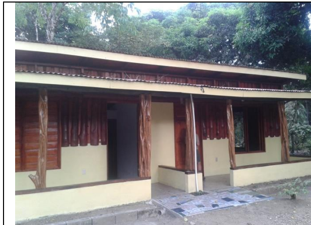
Habitaciones completamente equipadas