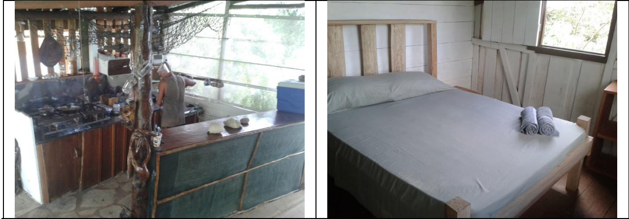
Mejoras en la casa grande