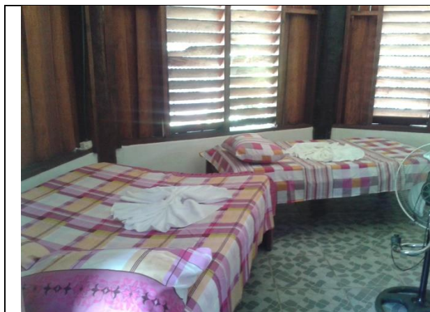
Habitaciones completamente equipadas

Las habitaciones están totalmente listas. Cuentan con las condiciones adecuadas para atención de grupos y turistas individuales. Baños en excelentes condiciones, camas y accesorios disponibles. En el mes de marzo 2015 iniciaron con la construcción de un restaurante, el cual tiene un diseño muy agradable.