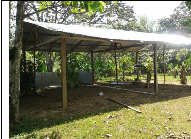
Construcción de centro de atención a turistas