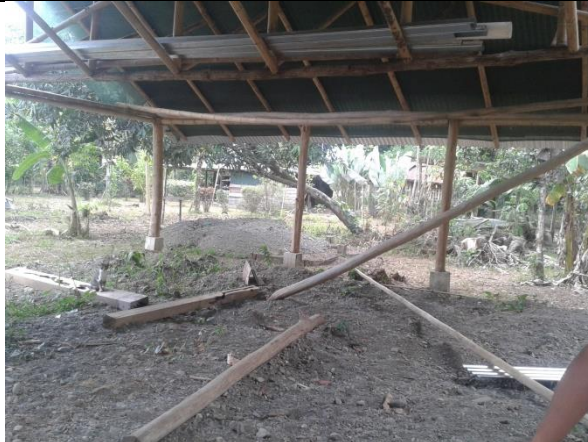
Arena esparcida para rellenar el piso