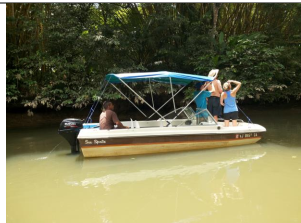
Bote Sea Sprite trabajando