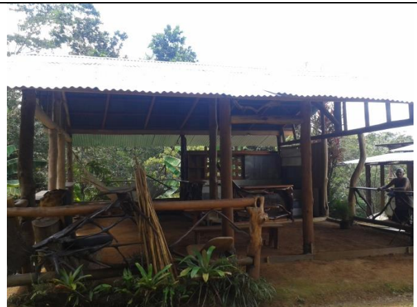
La nueva cocina