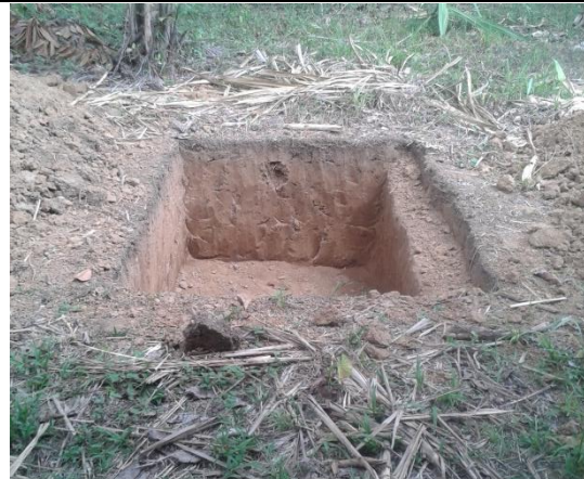
Hueco para tanque séptico