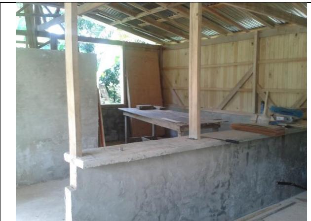
Construcción de la cabina para discapacitados