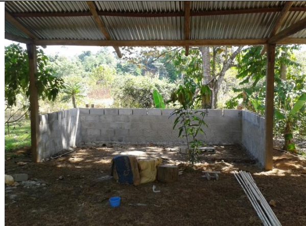
Construcción de servicios sanitarios y duchas