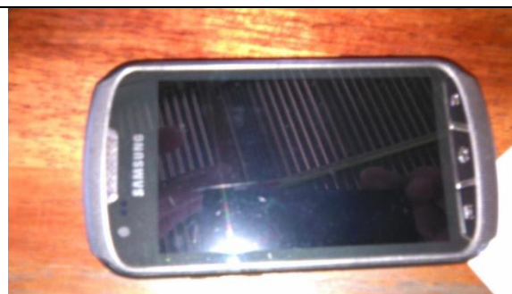
Maletín y teléfono celular

Como se mencionó anteriormente, se adjunta el anexo 1, en dónde se muestra el estado de los proyectos y el grado de cumplimiento, utilizando como base las recomendaciones de mejora ofrecidas en el 2013.