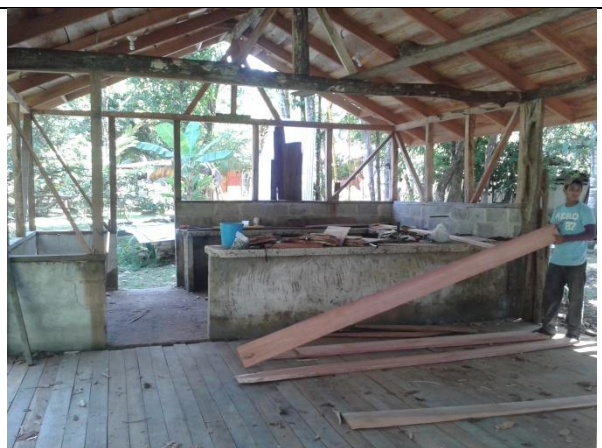
Construcción de restaurante