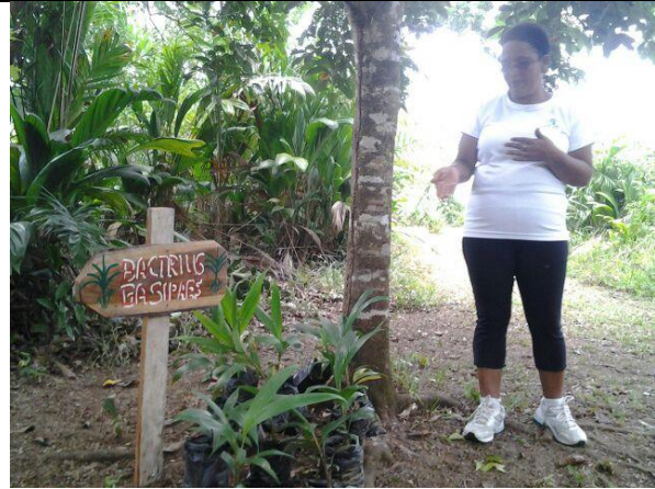
Inauguración oficial del proyecto de Palmito