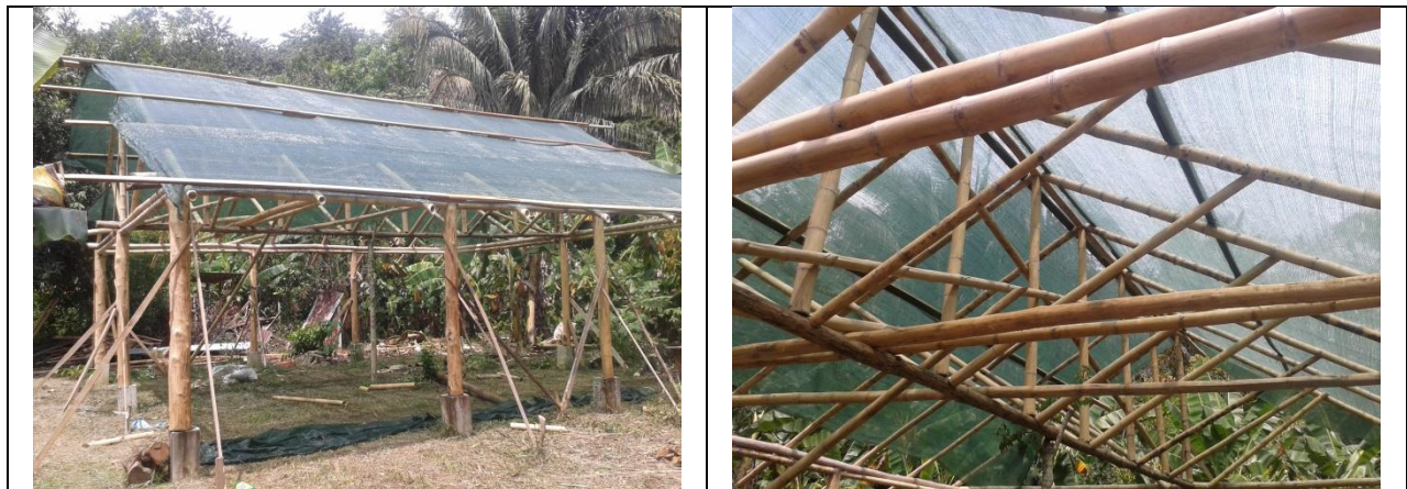
Construcción de Área de Camping