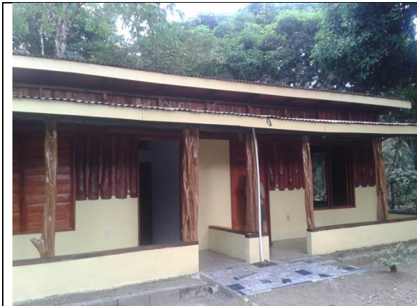
Mejoramiento de la infraestructura