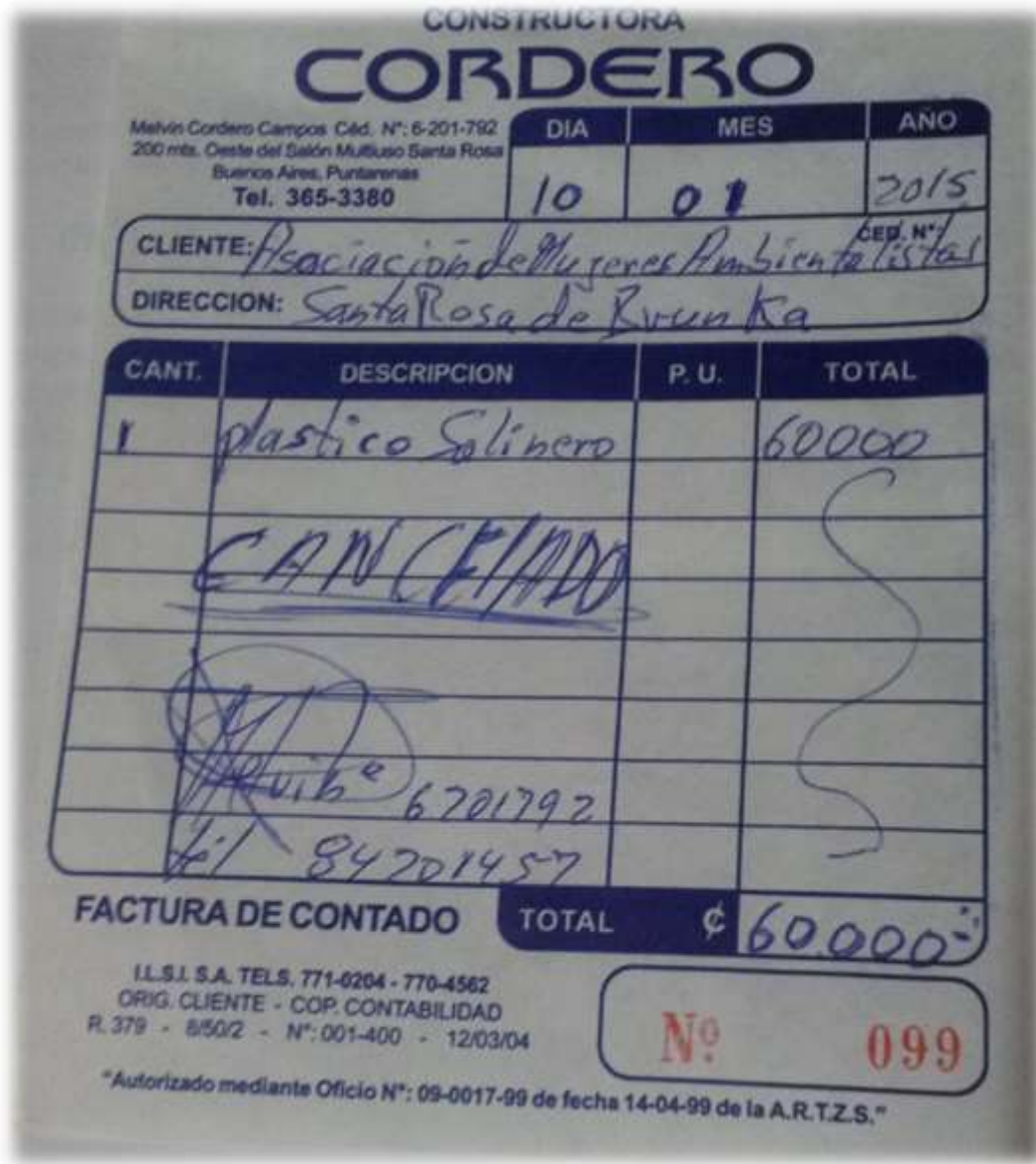
Ilustración 9: Contrapartida