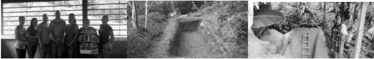
Consultoría sobre uso de los fondos