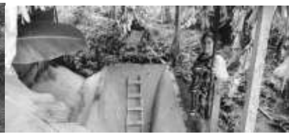
Consultoría sobre uso de los fondos