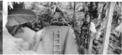
Consultoría sobre uso de los fondos